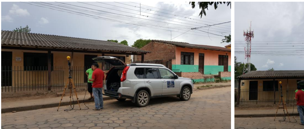
Imagen 2.- Sitio me medición