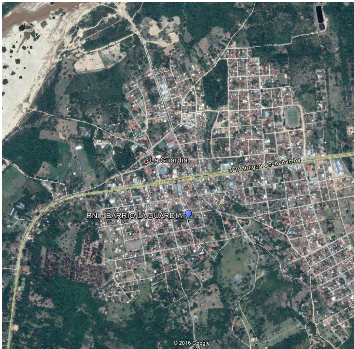
Imagen 1.- Zonas de medición – Calle 24 de Septiembre No. 3355, localidad de La Guardia

Las mediciones de los niveles de Radiación Electromagnética fueron realizadas en el mes de Enero en el siguiente punto de la ciudad/localidad de La Guardia del Departamento de Santa Cruz: