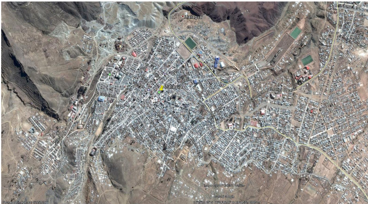
Imagen. - Zonas de medición, Llalagua – Potosí.

Las mediciones de los niveles de Radiación Electromagnética fueron realizadas en el mes de noviembre en el siguiente punto de la ciudad; Plaza principal 6 de agosto de la localidad de Llalagua, del departamento de Potosí: