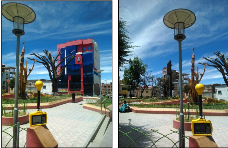
Imagen. - Sitio de medición