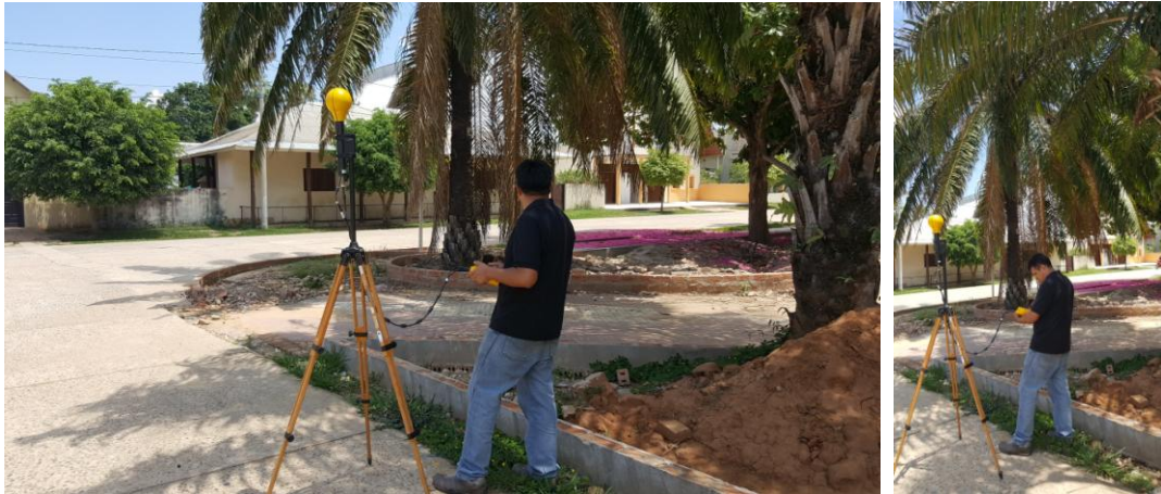
Imagen 2.- Sitio me medición