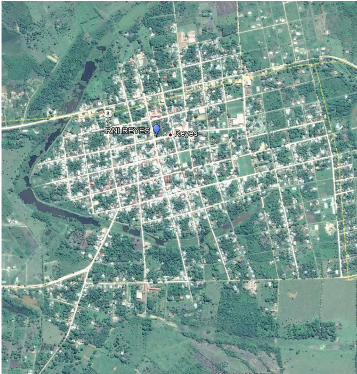
Imagen 1.- Zonas de medición – Ciudad de San Borja

Las mediciones de los niveles de Radiación Electromagnética fueron realizadas en el mes de septiembre en el siguiente punto de la ciudad/localidad de Reyes del Departamento de Beni: