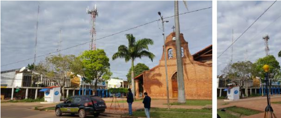
Imagen 2.- Sitio me medición