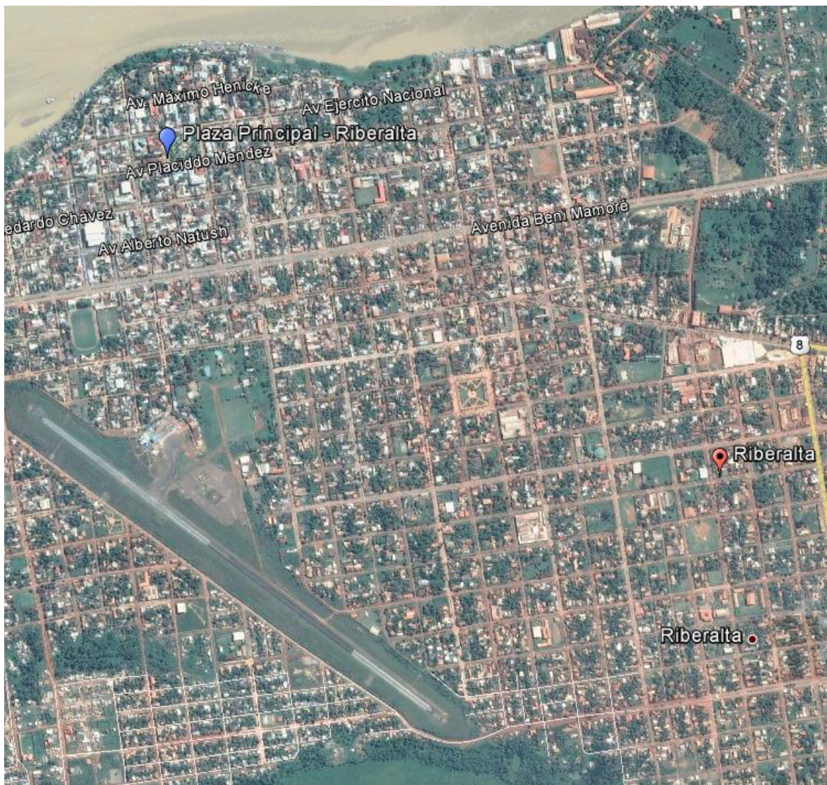
Imagen 1.- Zonas de medición – Ciudad de Riberalta

Las mediciones de los niveles de Radiación Electromagnética fueron realizadas en el mes de Abril en el siguiente punto de la ciudad/localidad de Riberalta del Departamento de Beni: