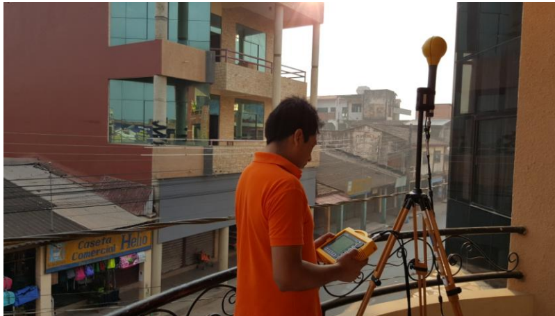
Imagen 2.- Sitio me medición