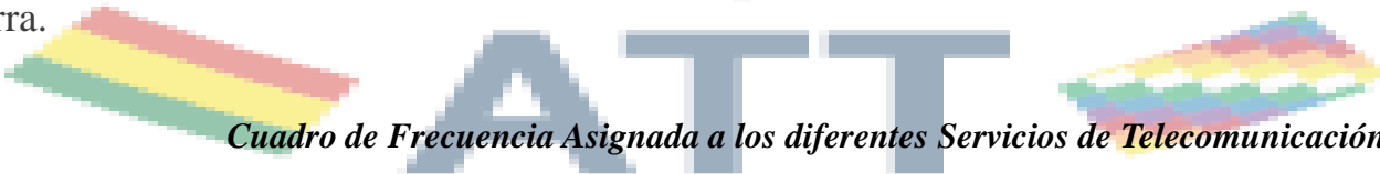
Cuadro de Frecuencia Asignada a los diferentes Servicios de Telecomunicación

De acuerdo al informe técnico ATT-OFR SZ-INF TEC SC 430/2019, se tiene los siguientes resultados de la medición de radiación no ionizante realizada en la ciudad de Santa Cruz de la Sierra.