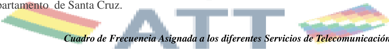
Cuadro de Frecuencia Asignada a los diferentes Servicios de Telecomunicación

De acuerdo al informe técnico ATT-OFR SZ-INF TEC SC 394/2019, se tiene los siguientes resultados de la medición de radiación no ionizante realizada en la localidad de Roboré del Departamento de Santa Cruz.