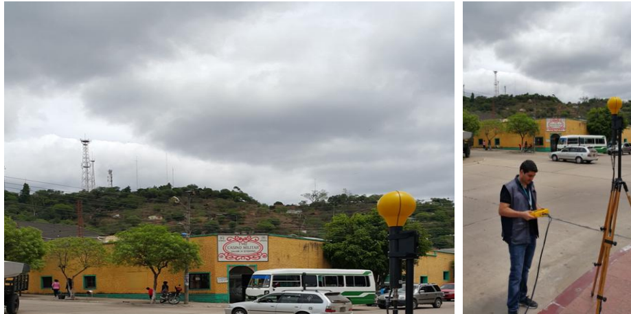
Imagen 2.- Sitio me medición