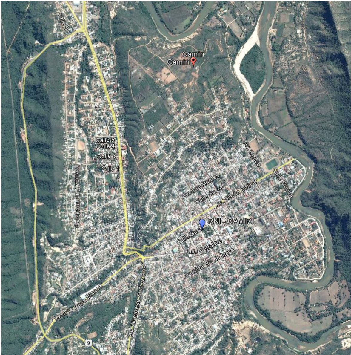
Imagen 1.- Zonas de medición – Ciudad de Gutiérrez

Las mediciones de los niveles de Radiación Electromagnética fueron realizadas en el mes de Octubre en el siguiente punto de la ciudad/localidad de Camiri del Departamento de Santa Cruz: