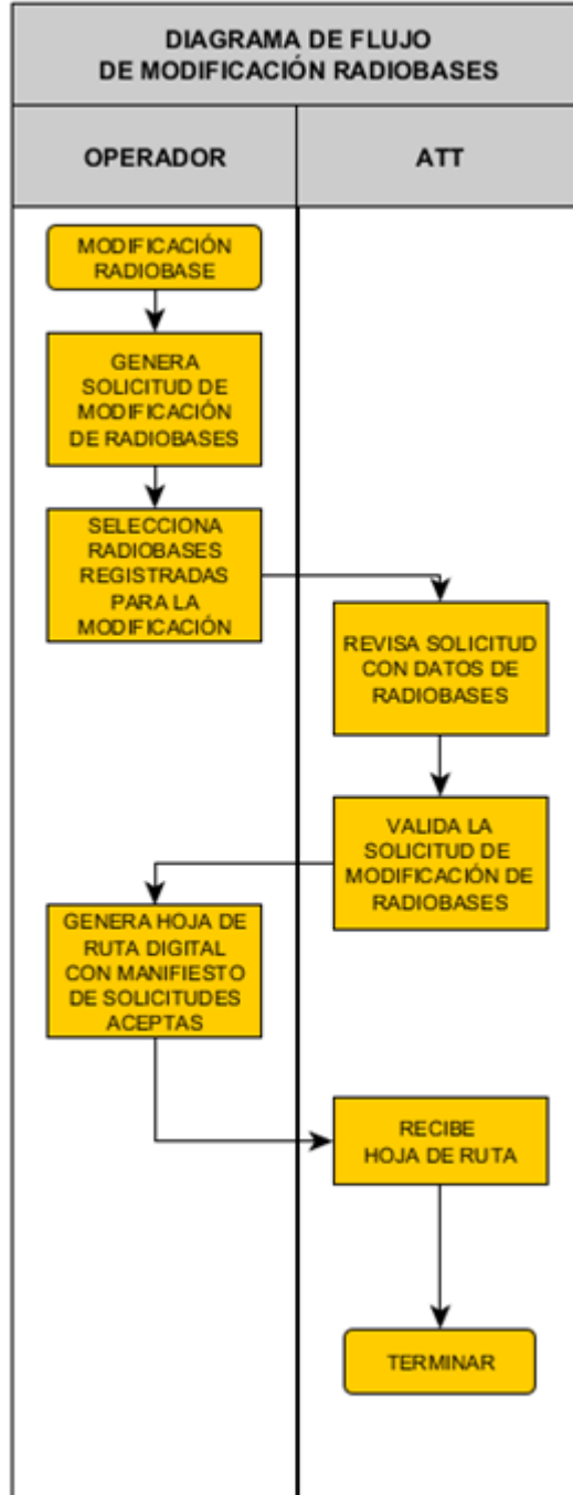
Gráfico 4: Diagrama de Flujo – Modificación de Radiobases