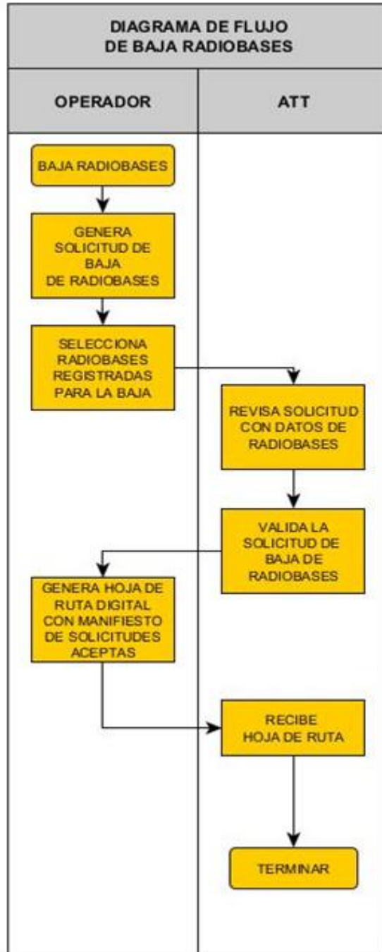
Gráfico 3: Diagrama de Flujo – Baja de Radiobases