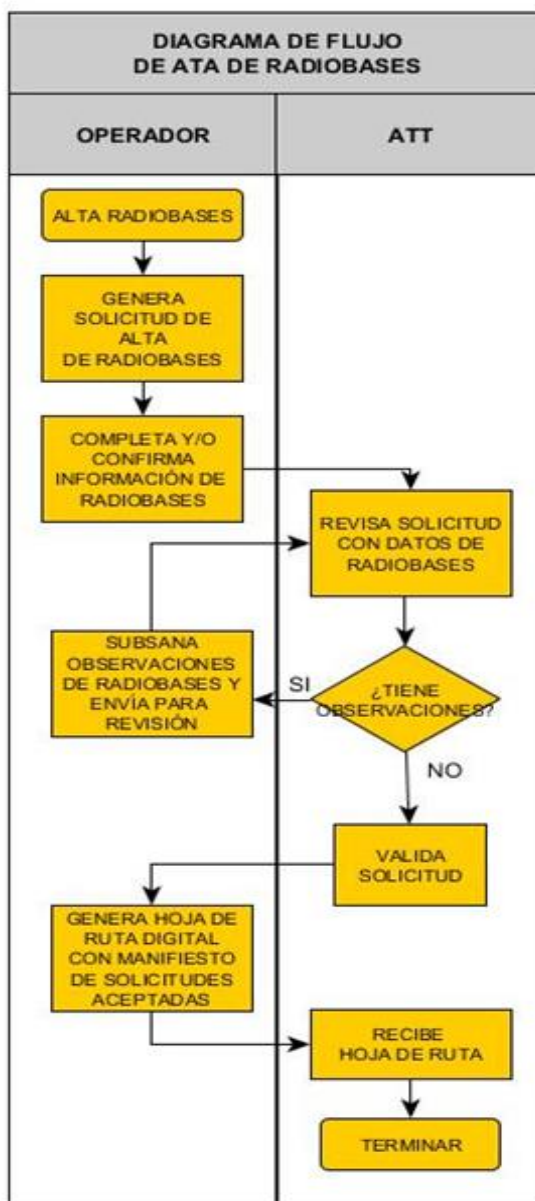
Gráfico 2: Diagrama de Flujo – Alta de Radiobases